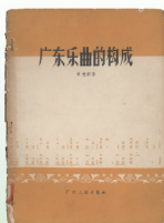
《廣東樂曲的構成》，陳德鉅著，1957年，廣東人民出版社出版。書中用許多具體的實例闡釋了廣東樂曲的特點，對於曲調、音韻、樂譜、樂器、樂句、樂段等作了系統的研究和說明。