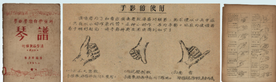
《粵曲粵東自學資料：琴譜（附錄鼓擊法）》，羅良運編著，1957年，藝群油印社承印。書中介紹了工尺譜與簡譜、訂板和拍子的認識，梵鈴、洋琴、三弦、二胡幾種樂器的介紹，手影的使用，鑼鼓擊法，粵曲訂板和鑼子彈唱等。