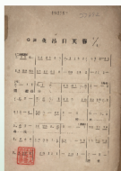
《夜吊白芙蓉風琴劇曲譜》，劉敬汝譯譜，民國十二年（1923），丁蜀圖書構造社印。