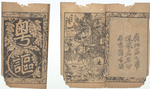
《粵謳》，不分卷，招子庸。出版年不詳，通整局石印版。首頁有梁秋田繪於清光緒三十一年（1905）的《珠江月夜》圖。 廣東省立中山圖書館（廣東省古籍保護中心）藏

粵謳又名解心腔，是清嘉慶年間發展出來的一種短調歌體，在珠江歌娘中尤其流行。道光八年（1828），南海文人招子庸編撰《粵謳》出版，廣為流通，往後百多年間一版再版。其後，以“粵謳”的文體格式寫作的短篇，在清末報刊頻繁出現，多以諷刺時事為題。時至20世紀20年代，晚清著名外交官員廖恩燾（1864-1954）化名“珠海夢餘生”撰作的《新粵謳解心》出版，更把這種舊文體與新情事結合得淋漓盡致。不過，粵謳之作為歌體，則逐漸為人所淡忘，至今只剩下一些餘音遺韻。