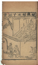
《送寒衣湘子記》，唱本合訂本，廣州以文堂、德文堂板刊印，含多首龍舟歌。