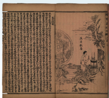
《改良繪圖真好唱》，四集三卷。