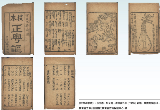
《校本正粵謳》，不分卷，招子壽。清宣統二年（1910）新編，麟書閣機器印。 廣東省立中山圖書館（廣東省古籍保護中心）藏