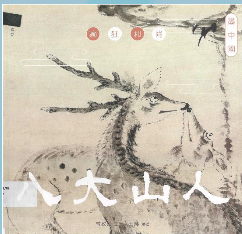
癡狂和尚： 八大山人