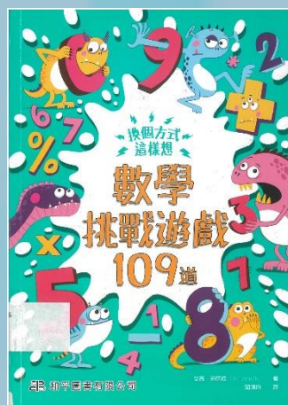
換個方式這樣想： 數學挑戰遊戲 109 道