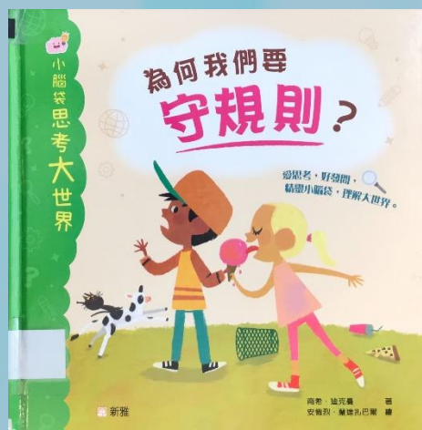
為何我們要守規則?