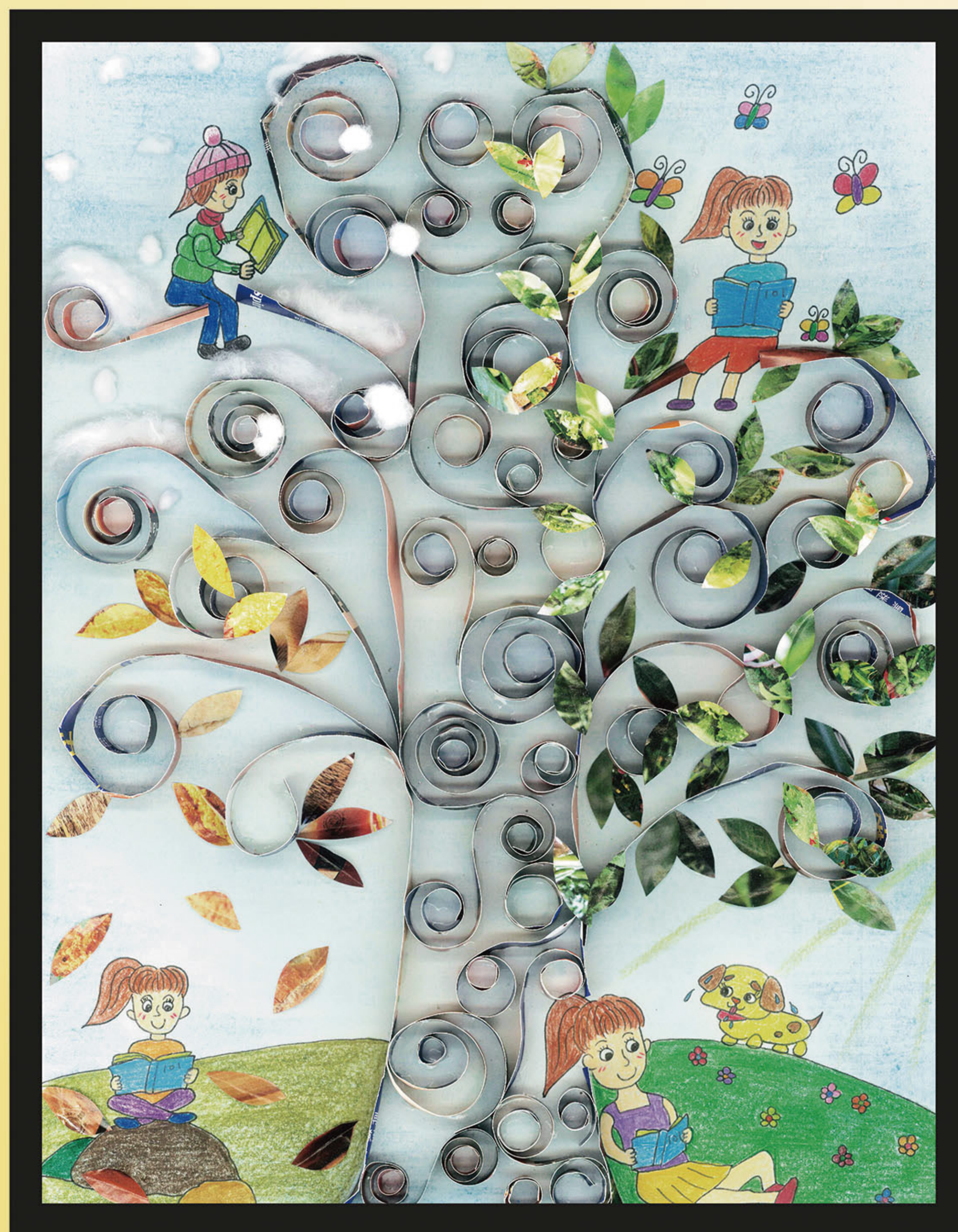
優勝獎 何洛潼 聖羅撒英文中學 小三 作品名稱 愛閱讀的我