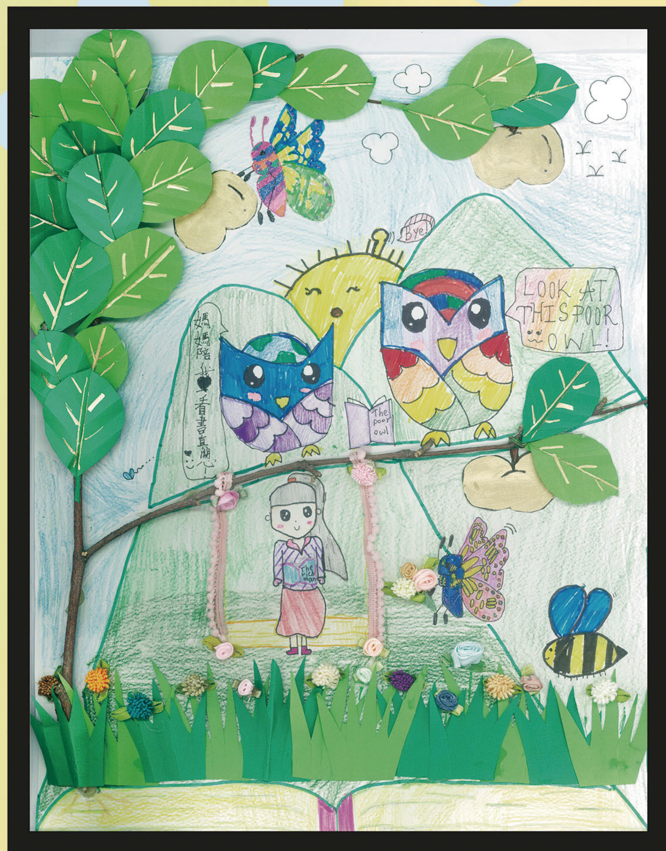
優勝獎 戴小穎 聖羅撒英文中學 小三 作品名稱 愛閱讀的我