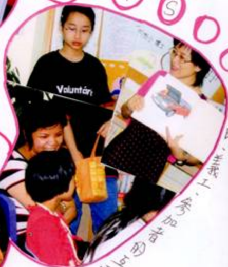
導師、主我 ... 專何西研活樂、上