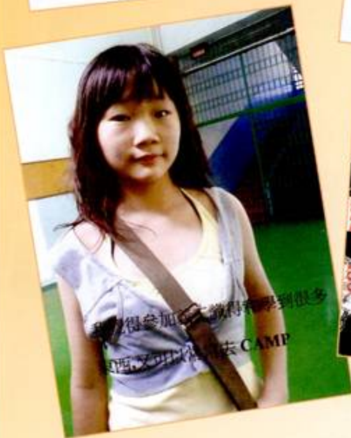
覺得參加之後,覺得學到很多東西,又可以出去CAMP