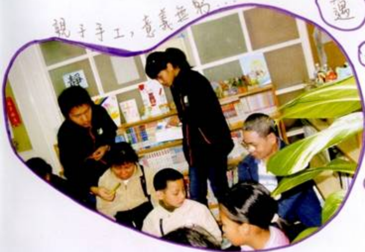
親子手工，意義無窮