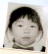
by:迷仔喜來登圖書館義工