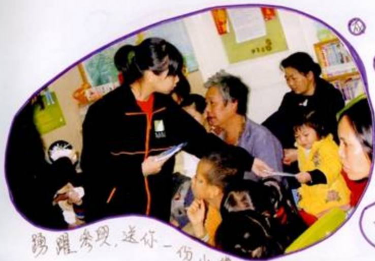
踴躍參與，送你一份小禮