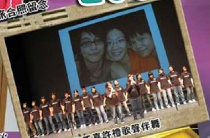
義工嘉許禮歌聲伴舞