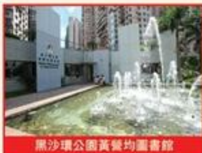
黑沙環公園黃營均圖書館