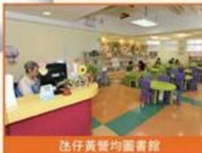
氹仔黃營均圖書館