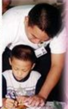
手把手·大隻哥哥教你做手工