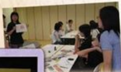
義工在編輯班學習製作可愛的編輯