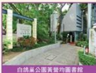
白鶴巢公園黃營均圖書館