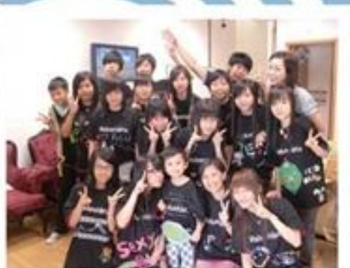
休息一陣 表演時就會醒神d啦