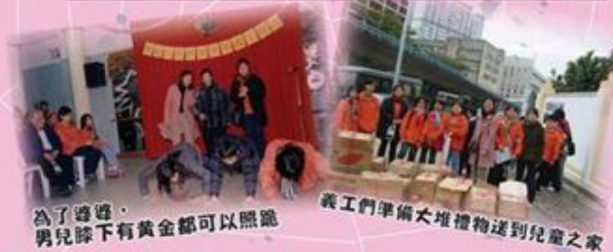
為了婆婆， 男兒膝下有黃金都可以照跪