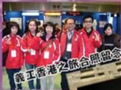
義工香港之旅合照留念