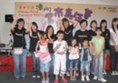
書市嘉年華義工故事表演