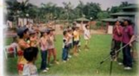
2003年兒童節義工協助戶外活動