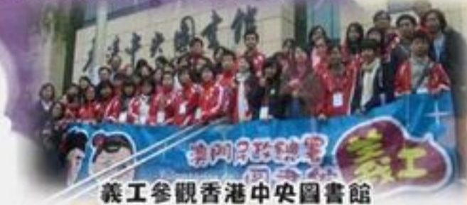
義工參觀香港中央圖書館