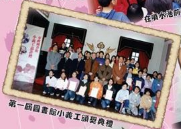
第一屆圖書館小義工頒獎典禮