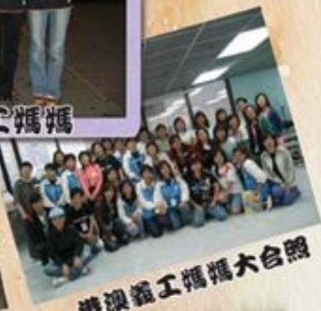
港澳義工媽媽大合照