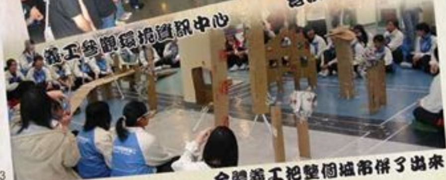
全體義工把整個城市拼了出來