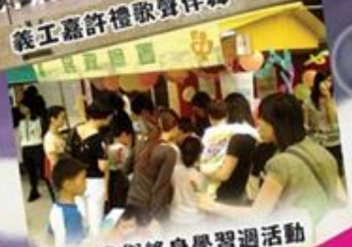
參與終身學習週活動