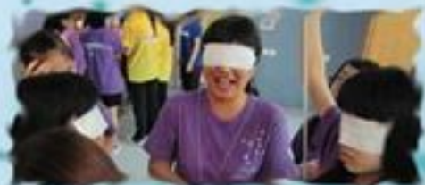
我們閉上了眼睛也能完成任務！