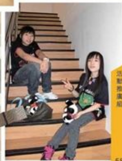
每件道具都係我哋嘅心血結晶