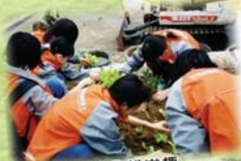
義工們享受農耕樂趣