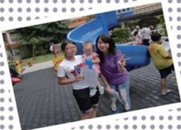
37 派傳單之餘仲派埋氣球