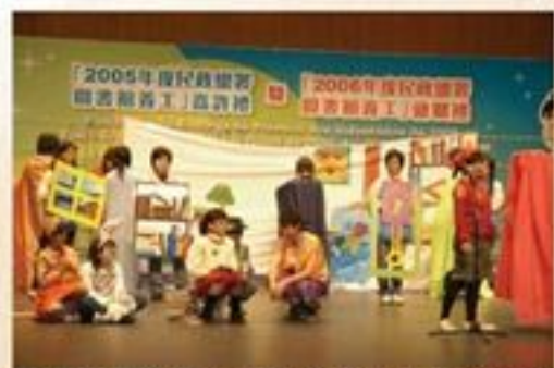
義工在嘉許禮演出與圖書館為題的話劇