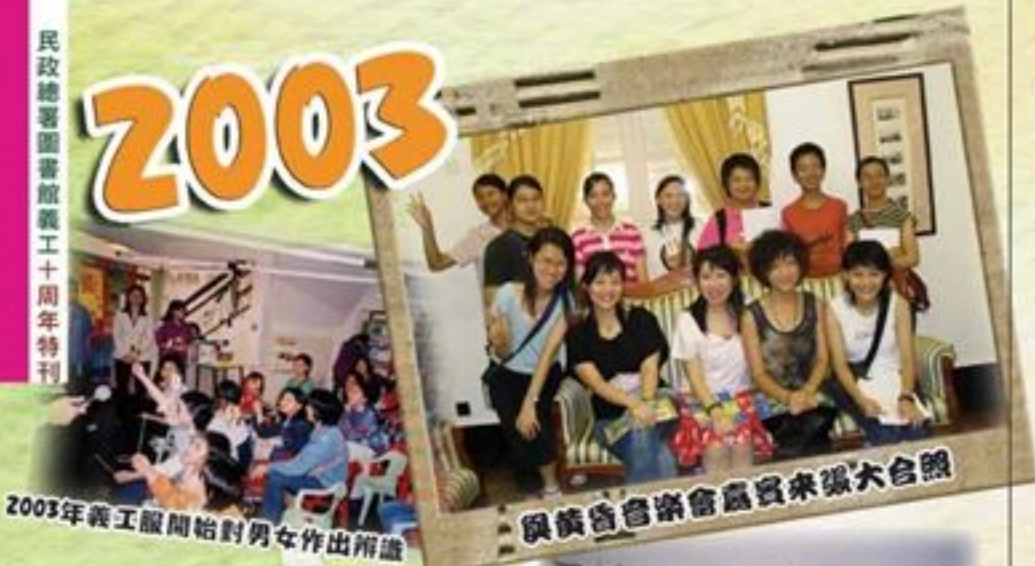
與黃昏音樂會嘉賓來張大合照