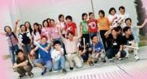
2001年參觀澳大圖書館