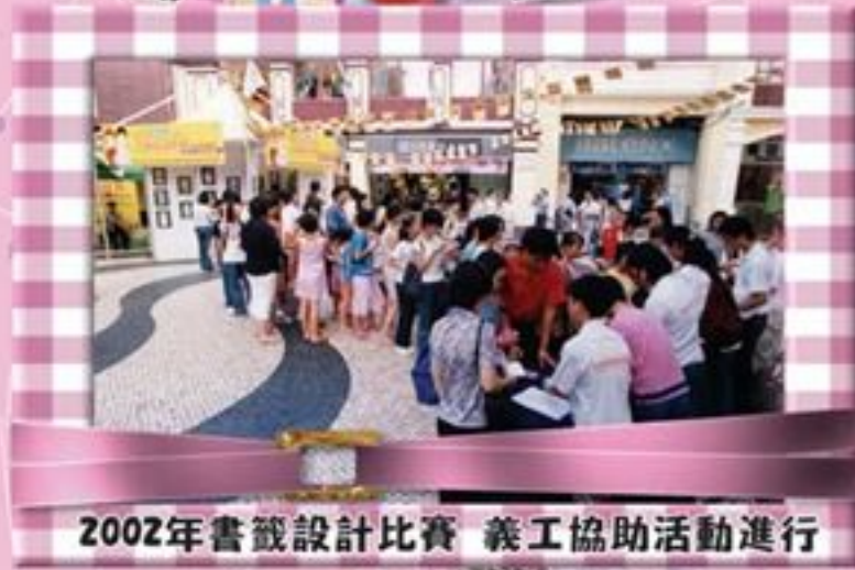
2002年書籤設計比賽 義工協助活動進行