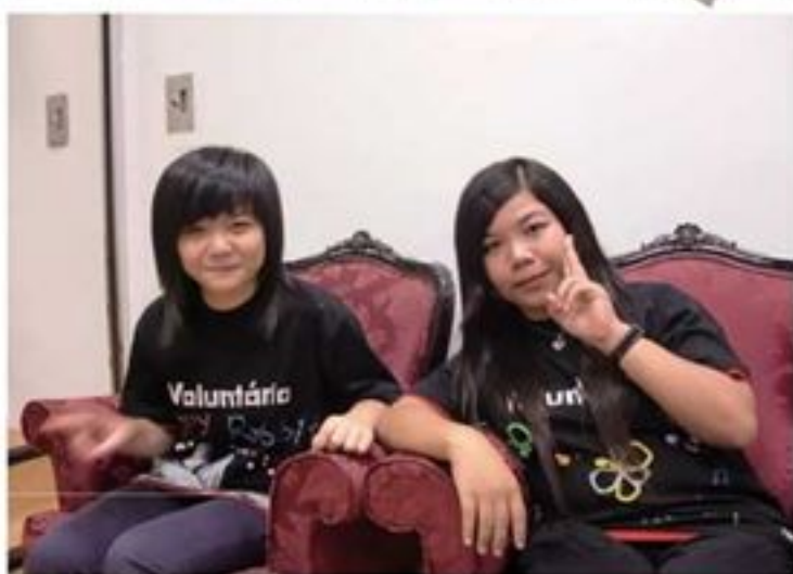
兩姊妹一齊表演 特別有意義