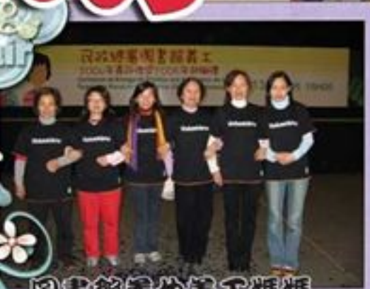
圖書館美侖義工媽媽