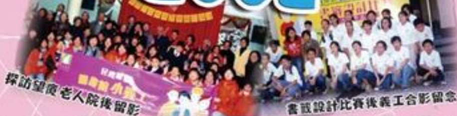
探訪望廈老人院後留影