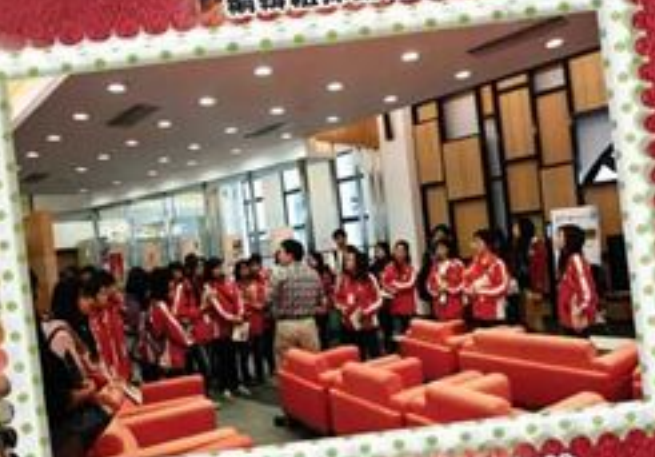
編輯組探訪鉅記餅家