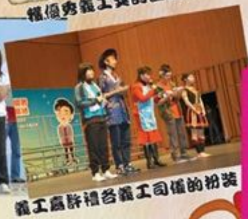
義工嘉許禮各義工司儀的扮裝