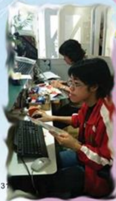
借還書工作無難度