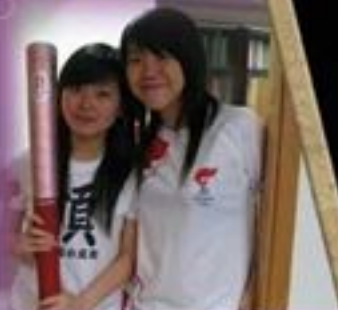
代表澳門傳遞奧運聖火