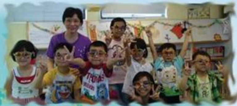
我們的自製眼鏡好看嗎？