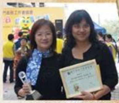
2006優秀義工選舉權得優秀義工