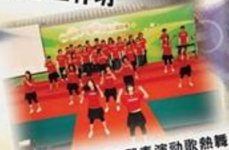
義工嘉許禮義工們表演勁歌熱舞