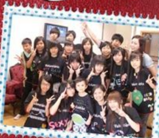
義工頒獎禮後台大合照