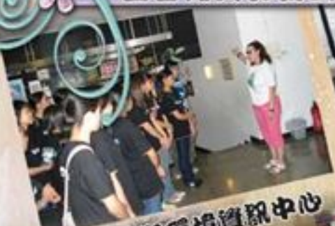
義工參觀環境資訊中心