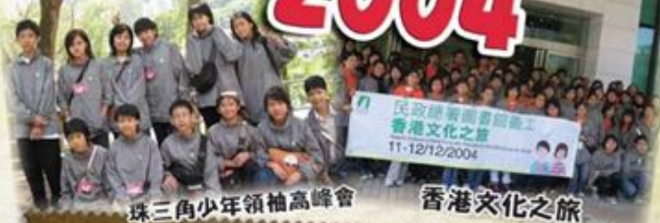
珠三角少年領袖高峰會