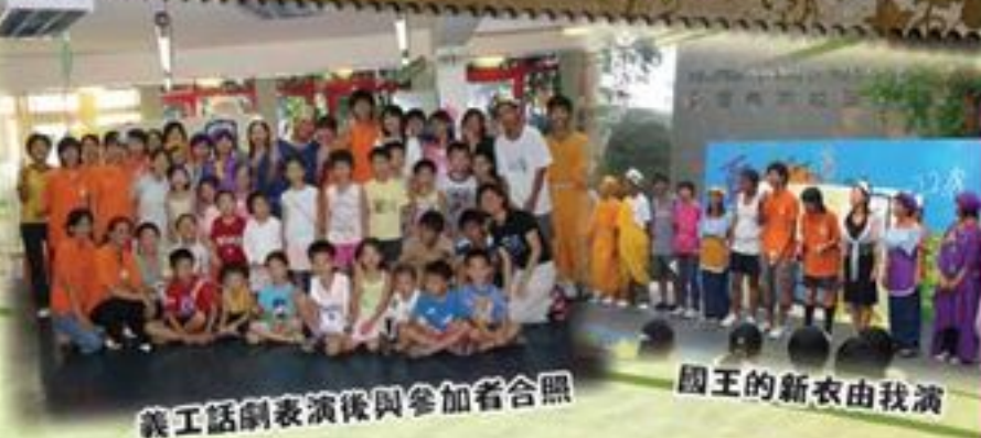
義工話劇表演後與參加者合照