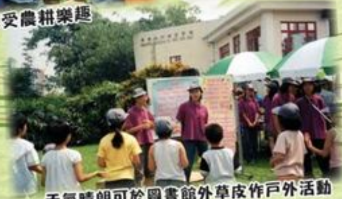
天氣晴朗可於圖書館外草皮作戶外活動