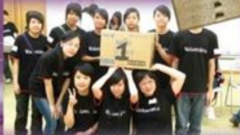
義工聚會遊戲中獲冠軍的大禮物