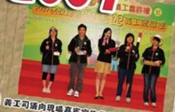
義工司儀向現場嘉賓宣佈義工嘉許禮正式開始