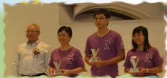
35 義工無私的貢獻·終會有成果！