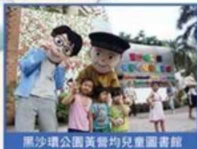
黑沙環公園黃營均兒童圖書館

各圖書館每月均定期舉辦不同類型的活動，其中包括故事天地、親子共讀、書友仔聚會、各類型專題講座等，以滿足不同年齡層讀者的需要。除了定期活動外，圖書館還會與不同團體合作，舉辦各類型閱讀推廣活動，如圖書館周、終身學習週、穗港澳少年兒童閱讀計劃等。