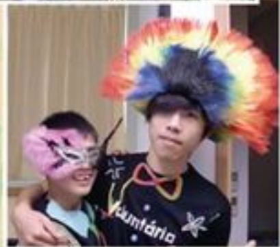
開工時開工，玩樂時玩樂!!