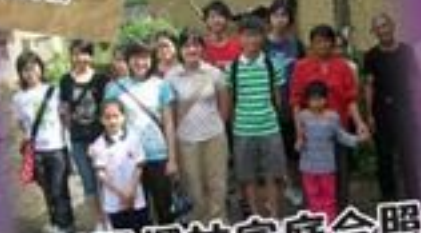
與韶關探訪家庭合照