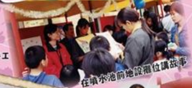
在噴水池前地設攤位講故事