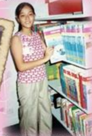
第一屆義工·你現在在哪呀