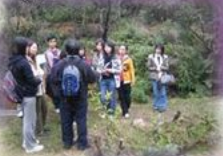
編輯組探訪路環濕地保護區