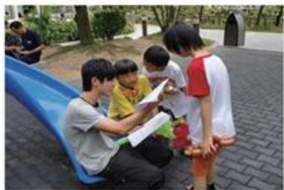
小朋友認真聽，哥哥開心講~