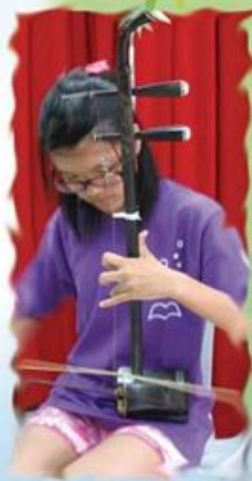
圖書館義工多才多藝！