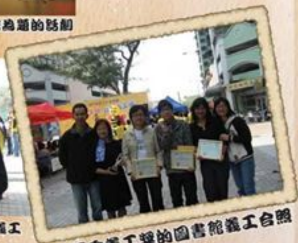
權得優秀義工獎的圖書館義工合照