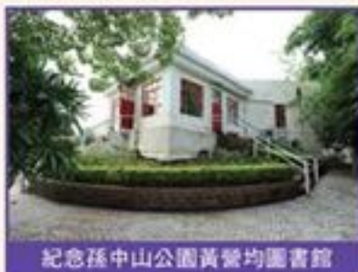
紀念孫中山公園黃營均圖書館